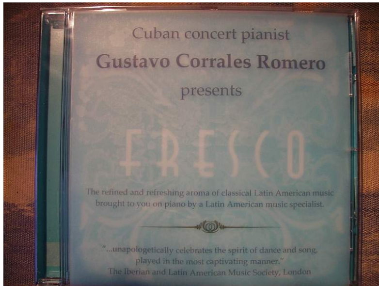
FRESCO CD met etiket, als verzocht door sommige consignatiehouders, om de verkoop te vergemakkelijken.

hadden. Ik dus aan de slag met mijn voltijd baan, het vinden van een piano, het onderzoeken van verhuurmogelijkheden en het verhuizen. En G met het klussen aan het gevonden appartement terwijl hij ook de competitie moest voorbereiden; zijn tijd verdelend tussen het schilderen, studeren en de pianolessen aan zijn eerste leerlingen.